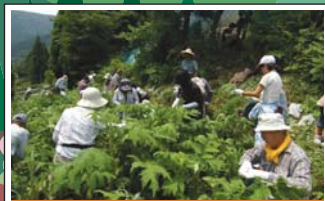
里の恵みを活かした地域振興 Regional vitalization through utilization of natural resources 里の恵みを活かして、都市と農村の交流による地域活性化が図られています。Regional vitalization projects are underway in the form of utilization of natural resources and the promotion of exchanges between villages and cities.