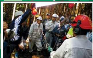
多様な主体による森林整備 Forest management in various sectors 市民ボランティアをはじめとした多様な主体により森林整備が行われています。Various sectors, including volunteer groups, are working for forest management.