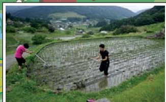
棚田の保全活動 Conservation of terraced rice fields 都市と農村の交流やブランド米の生産など、多様な活動が展開されています。Various activities are currently underway such as the promotion of exchanges between villages and cities, and the production of brand-name organically-cultivated rice.

集落や農村自然環境等の保全・再生に向けて、棚田保全に関する活動、シデコブシや湿地保全活動、集落に関する調査などが行われています。活動を通じて、地域資源を活用した地域活性化や、自然と共生する生活様式および集落の伝統的知恵の収集・継承など、自然と共生する持続可能な地域づくりが進められています。