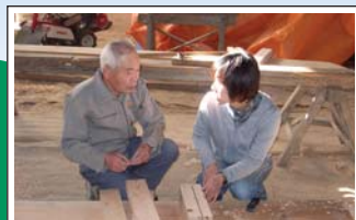
伝統的知恵の収集 Surveys on local traditions and cultures 調査により山里に息づいてきた知恵や技術が収集され、その継承に役立てられています。Interviews with local people help us to collect information on and preserve local traditions and cultures.