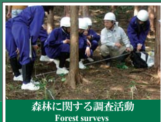
森林に関する調査活動 Forest surveys 森の健康診断など市民、研究者等の協働・連携により広範な調査が行われています。Citizens and researchers are working together to survey forest ecosystems extensively. One example of this is the "Mori no Kenkoushidan," which surveys and evaluates forestry ecosystem health.

Various approaches have been taken to conserve and restore forest ecosystems, including; forest management such as thinning operations, forest surveys and secondary forest conservation such as burning charcoal. Volunteer groups are working actively on forest conservation in the Chubu region. Various sectors such as citizen groups, research organizations and private companies are working together for better forest management.