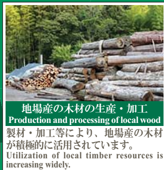
地場産の木材の生産・加工 Production and processing of local wood 製材・加工等により、地場産の木材が積極的に活用されています。Utilization of local timber resources is increasing widely.