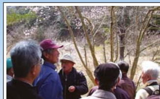
東海丘陵要素の保護活動 Conservation of endemic species 東海丘陵要素の代表種であるシデコブシなどの保護活動のネットワークが広がっています。Conservation activities for endemic species such as Magnolia stellata in the Tokai area are expanding throughout the region.