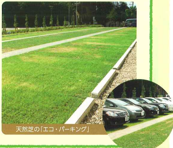
天然芝の「エコ・パーキング」