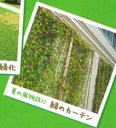
夏の風物詩に 緑のカーテン