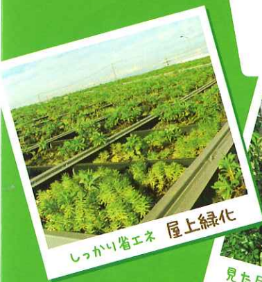
しっかり省エネ 屋上緑化