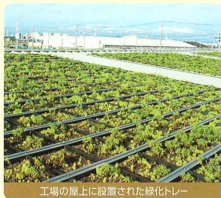
工場の屋上に設置された緑化トレー

熊本清掃社の「バイオプラザなごや」は、廃棄食品を「堆肥」に再生するリサイクル工場。その屋根に、乾燥に強く、メンテナンスがほとんどいらぬマンネングサ科を使用したトレーを平成21年6月に設置(緑化面積は1,026 m 2 )。この屋上緑化は、「食品廃棄物に関し、肥料への再生利用に努め、環境負荷の少ない循環型社会の構築」をめざす同社の経営方針に沿ったもの。効果として、企業イメージの向上だけでなく、屋根の温度を下げ夏場の空調負荷の削減に大きく寄与しています。