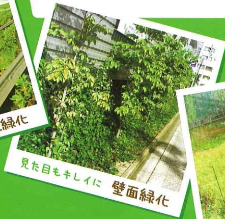
見た目もキレイに 壁面緑化