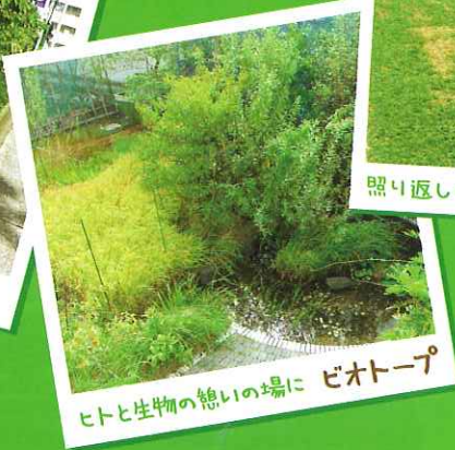
人と生物の憩いの場に ビオトープ