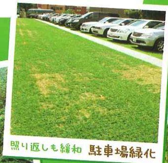
照り返しも緩和 駐車場緑化