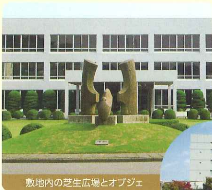
敷地内の芝生広場とオブジェ

緑の植栽の中に彫刻作品を配置することで、単なる緑化にとどまらない「芸術性あふれる緑の空間」に仕上げている日東工業の本社敷地内。これは創業者が従業員の安らぎの場にするため、「公園のような工場」をめざして環境整備を推し進めたことによるもの。正門を入ると真っ先に見える広大な芝生広場とオブジェはその象徴です。また、「職場に花と緑を」のコンセプトに従い、屋上や中庭にも庭園を造営し、従業員の疲れを癒し、安らぎを与えるのに役立っています。