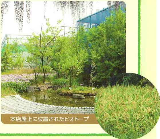
本店屋上に設置されたビオトープ

平成10年、「都市部における自然環境復元の先駆的な技術開発」のため、本店屋上にビオトープ(面積180㎡)を設置した株式会社テクノ中部。屋上ビオトープには池・水田・湿地・植栽を配し、蛙・魚・昆虫など多様な生物が生息できる緑地を創出しています。池では悠々と小魚が泳ぎ、木にはキジバトの巣も。従業員にとって、気候の良い季節には昼休みの憩いの場になるとともに、水田で田植えや稲刈りを行うなど、秋の収穫も楽しみとなっています。敷地面の制約が多い都市部のビルにおいて参考となる一例です。