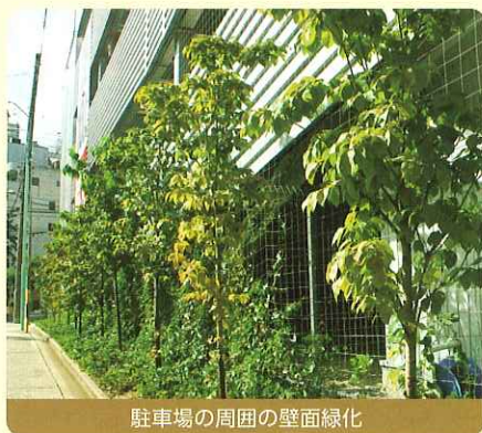
駐車場の周囲の壁面緑化

「壁面緑化により、都市景観の向上に寄与する」・・・そんな理念を実現するため、立体駐車場(地上4階建て)の周囲につる植物を這わせて栽培する「緑のカーテン」に取り組む東桜ビル株式会社。つるの高さは、植栽から1年しか経過していないため1階部分に留まっていますが、3~4年後には4階まで達する見通し。そうなれば清涼感が増し、安らぎのある空間として地域にも貢献できる存在となるでしょう。手軽に始められるうえにメンテナンスが最小限で済む点も、多くの企業の参考となる好例だといえます。*この緑化事例は、名古屋市の民間施設緑化支援事業を活用