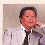
タケカワユキヒデ