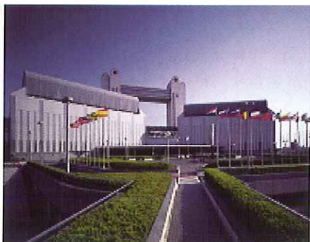
名古屋国際会議場 (COP10会場)

環境分野で最大規模の国際会議である生物多様性条約第10回締約国会議(COP10)がいよいよ開催されます。