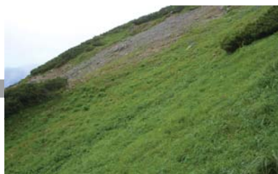
▲平成 17 年 7 月