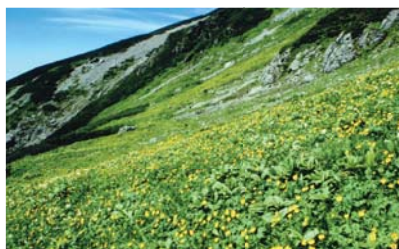
▲昭和 54 年 7 月

高山帯では、長い年月をかけて固有の生態系が育まれてきました。近年、ニホンジカが高山帯に侵入するようになり、南アルプスでは、高山植物が食べられ激減しています。北アルプスでも同様の被害が懸念されており、現在目撃情報を収集しています。