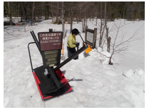
上高地冬期利用（標識・ロープ撤去）