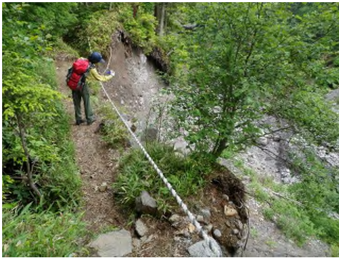
上高地登山道の巡視