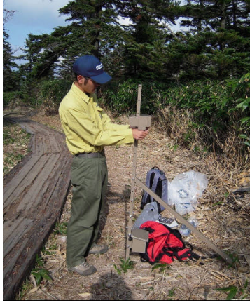
登山者カウンターの設置 (上信越高原地区)