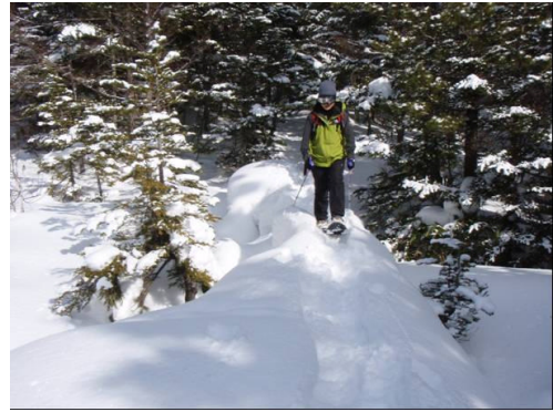
冬季利用状況調査 (中部山岳地区)