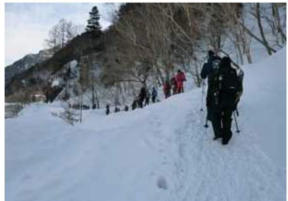
県道上高地公園線の雪崩跡を越える入山者