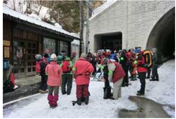
釜トンネル入口での入山の様子