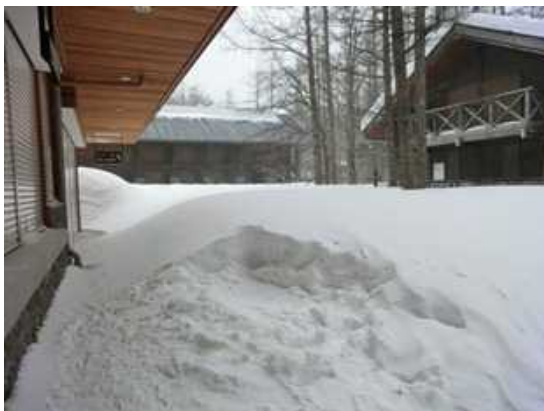
指定地外でのテント設営跡