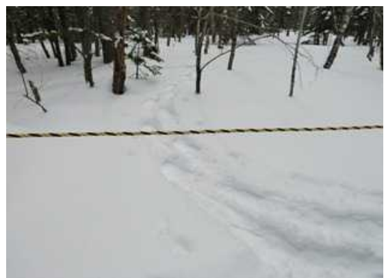
田代湿原への踏み込み