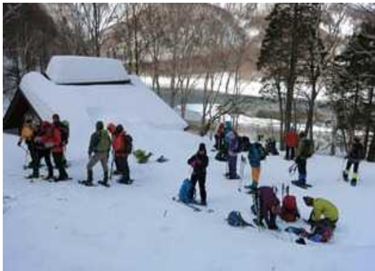
上高地内でのツアーの様子