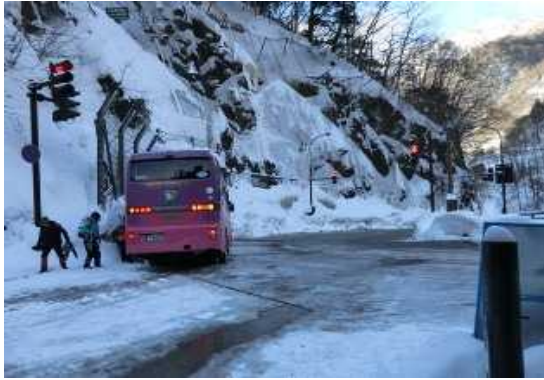
バスツアーによる入山の様子