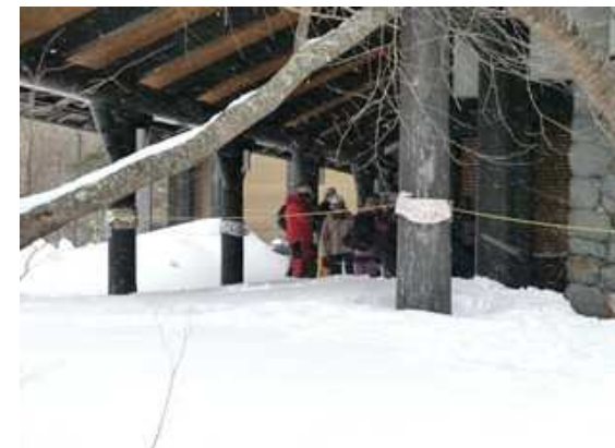
施設軒下への立ち入り