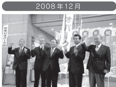
日本ジオパークに認定される