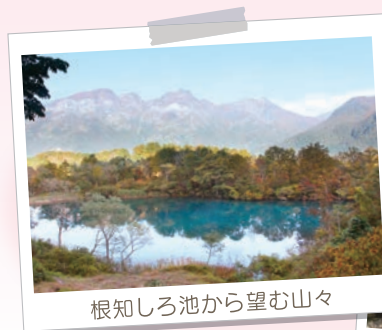
根知しろ池から望む山々

糸魚川市出身で、糸魚川ジオパーク大使、フリーキャスター。大学在学中より報道情報番組のキャスターを務める。2002年にNYへ留学、アメリカ社会学を学ぶ。現在は国内外の様々な事例を取材して講演活動を行うほか、情報番組等でコメンテーターとしても活躍中。