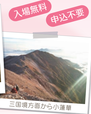
三国境方面から小蓮華