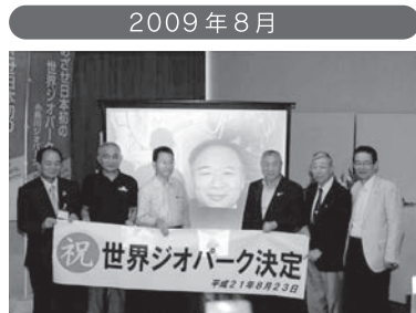
日本初の世界ジオパークに認定される