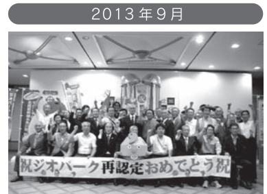
世界ジオパークに再認定される