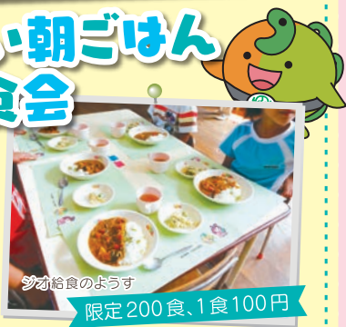
ジオ給食のようす

当日は、糸魚川世界ジオパークの大地で育った米や野菜などを食材にした特別メニューが食べられます。