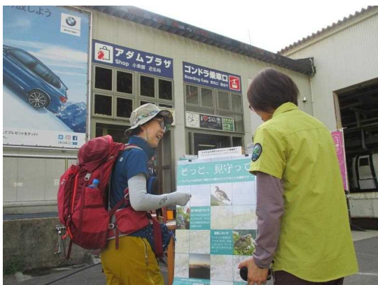
ライチョウ見守りキャンペーンの実施