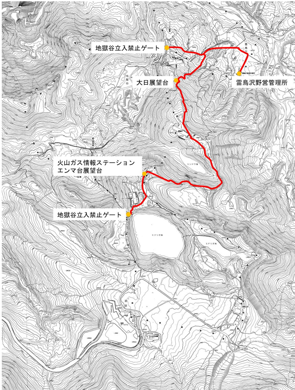
図. 火山ガス業務範囲