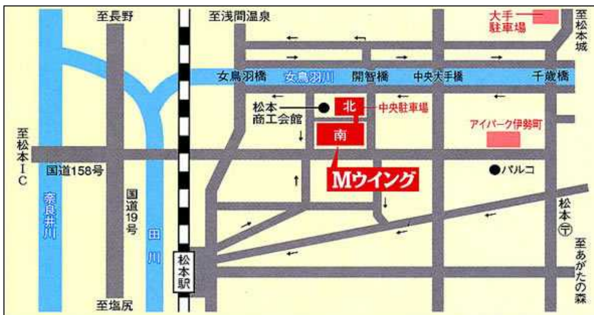
図 Mウイング位置図

■開催場所：松本市中央公民館Mウイング 3階 3-2会議室 TEL:0263-32-1132 （長野県松本市中央1-18-1）