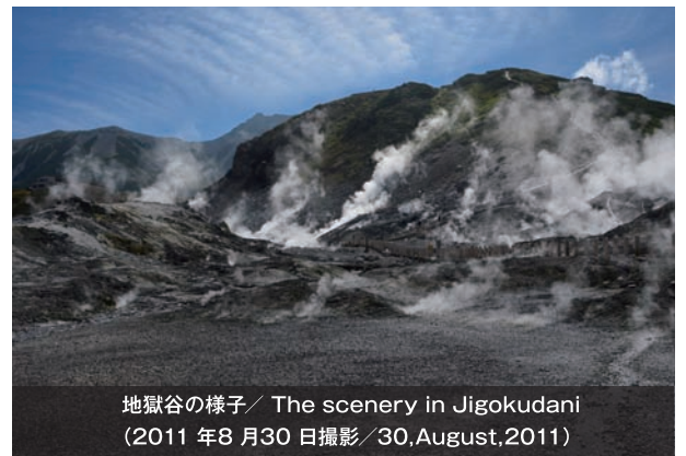
地獄谷の様子 / The scenery in Jigokudani (2011年8月30日撮影 / 30, August, 2011)

지고쿠다니 보도 주변은 분기활동이 활발하게 진행되고 있어, 화산가스 중독 사고 발생 위험이 높으니 당분간 통행을 삼가해 주시기 바랍니다. 지고쿠다니는 엔마다이에서 조망이 가능합니다.