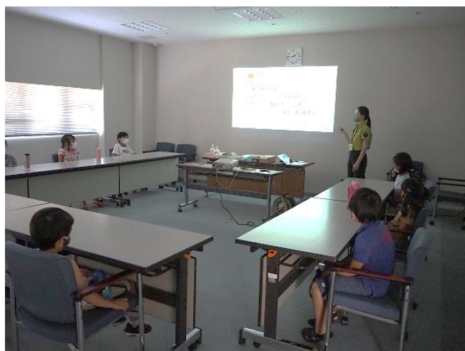
*鳥のおはなしの様子