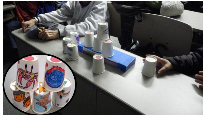
【紙コップで考える生態ピラミッド】