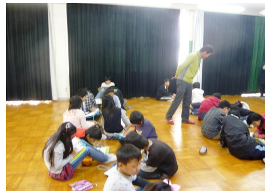
自分たちが出来ることを考え中