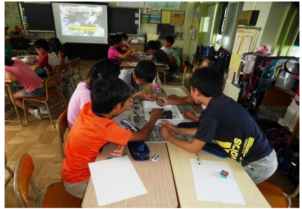
生きものと触れあう様子