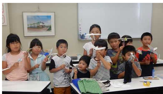
*制作した鳥を持って記念撮影

※出前講座については、名古屋自然保護官事務所 (TEL : 052-389-2877) までお問い合わせください。