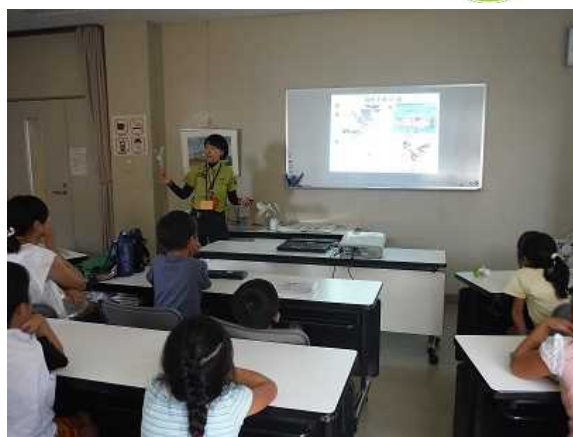
*鳥のおはなしの様子