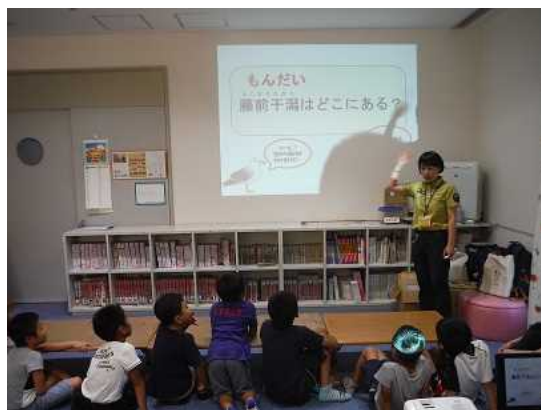
*藤前干潟のおはなし