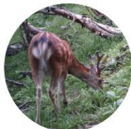
お尻の毛は常に白