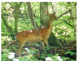
夏毛のニホンジカ (メス)