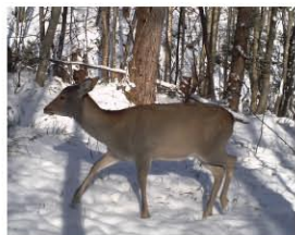
冬毛のニホンジカ (メス)

ニホンジカは夏と冬で体毛の色が異なります。夏毛のニホンジカは、茶色で鹿の子模様といわれる白い斑点があります。冬毛は灰褐色でオスは泥あびをして黒っぽくなります。いずれの時期にもお尻は白い毛でおおわれています。