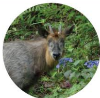
カモシカの角は黒くて短い

カモシカは灰色をしています。白っぽいものや黒っぽいものもいます。オス・メスともに黒くて短い角があります。