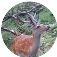
ニホンジカ (オス)の角は長くなります

ニホンジカは夏と冬で体毛の色が異なります。夏毛のニホンジカは、茶色で鹿の子模様といわれる白い斑点があります。冬毛は灰褐色でオスは泥あびをして黒っぽくなります。いずれの時期にもお尻は白い毛でおおわれています。