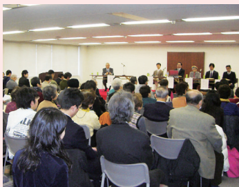
パネルディスカッションの様子

第1部では、「カーボンフットプリント制度」に関する理解を深めていただくため、基調講演及びパネルディスカッションを行ったほか、第2部では、中部4県から、『ストップ温暖化「一村一品」大作戦』に応募いただいた団体などからのポスターセッションを行いました。