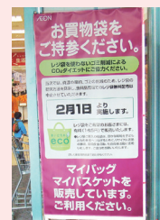
南信州レジ袋削減取り組みの店

この度、平成21年度の受賞者を決定し、中部地方では三重県津市の有限会社三功がリサイクルループ部門で奨励賞を受賞しました。