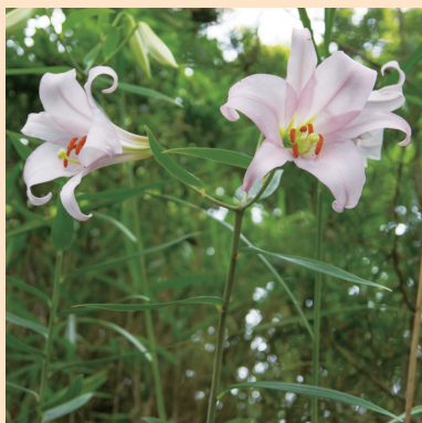
ササユリ (伊勢志摩国立公園) 本州中部から九州に分布する、ユリ科の多年草。6月から7月にかけて薄ピンク色の花を咲かせ、仄かな甘い香りがします。葉がササの葉に似ていることが名前の由来です。