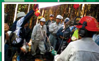
多様な主体による森林整備 Forest management in various sectors 市民ボランティアをはじめとした多様な主体により森林整備が行われています。Various sectors, including volunteer groups, are working for forest management.