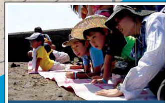
干潟に関する普及啓発 Education on the value and benefits of tidal flats 各地で干潟の観察会が行われ、干潟の機能や環境について学ぶ場となっています。 Learning through observation gives us the opportunity to understand the multifunctionality of tidal flats.