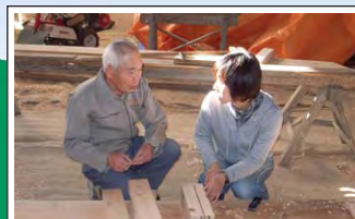
伝統的知恵の収集 Surveys on local traditions and cultures 調査により山里に息づいてきた知恵や技術が収集され、その継承に役立てられています。Interviews with local people help us to collect information on and preserve local traditions and cultures.