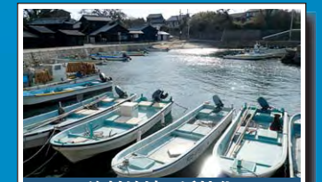
漁村地域の活性化 Regional vitalization in fishing villages 漁業資源の保全・再生やエコツアー等を通じて、漁村地域の活性化が図られています。 Regional vitalization projects in fishing villages are underway in the form of utilization of natural resources and ecotourism.