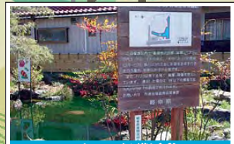
ハリヨの保護活動 Conservation of "Hariyo" ( Gasterosteus microcephalus ) 湧水地と流域河川に生息するハリヨの保護活動が活発に行われています。 Conservation activities for "Hariyo" ( Gasterosteus microcephalus ); numbers of this freshwater fish in spring-fed ponds and rivers are increasing in the region.