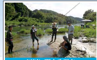
河川に関する調査 Surveys on river environments 淡水魚類等に関する調査・研究が進められています。 Surveys on freshwater ecosystems are currently underway in the region.

Various approaches have been taken to conserve and restore river environments, such as river surveys, river area management, conservation of freshwater ecosystems, education on river environments and the establishment of sustainable fisheries. Some of these activities aim for restoration of the cycle between forests and the sea, and conservation of regional biodiversity as a whole.