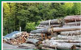
地場産の木材の生産・加工 Production and processing of local wood 製材・加工等により、地場産の木材が積極的に活用されています。Utilization of local timber resources is increasing widely.