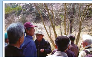
東海丘陵要素の保護活動 Conservation of endemic species 東海丘陵要素の代表種であるシデコブシなどの保護活動のネットワークが広がっています。Conservation activities for endemic species such as Magnolia stellata in the Tokai area are expanding throughout the region.