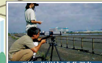
干潟・沿岸域の生物調査 Surveys on inhabitants of tidal flats and coastal areas 海の健康診断など、干潟に生息する底生生物、飛来する鳥類等の調査が継続的に実施されています。 Surveys on inhabitants such as benthic life and migratory birds are continually being performed. One example of this is the "Umi no Kenkoushundan," a survey and evaluation of marine ecosystem health.

Various sectors, such as national and local governments, citizen groups and nongovernmental organizations, private companies, and research organizations have been working for biodiversity in forests, satoyama, rivers and the sea in Ise Mikawa Bay Watershed. We aim to build a human network by interacting with those sectors and to conserve biodiversity as a whole in the region through restoration of sustainable natural cycles.