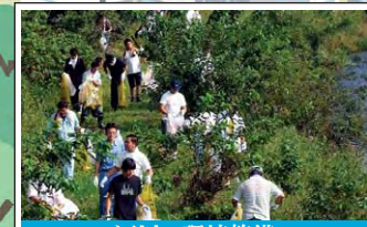
河川的环境整備 Management of river environments 市民・企業・自治体等の連携のもと、河川の清掃活動が実施されています。 Citizens, private companies and local governments are working together for river cleanup efforts.