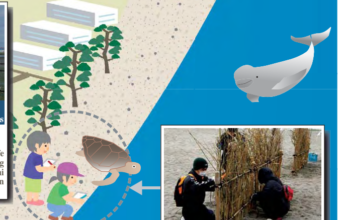
希少種の保護活動 Conservation of rare and endangered species アカウミガメの上陸・産卵に関する調査や保護活動が実施されています。 Surveys are underway on the coming ashore and laying of eggs of Caretta caretta , and there are conservation activities dedicated to them.