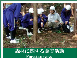
森林に関する調査活動 Forest surveys 森の健康診断など市民、研究者等の協働・連携により広範な調査が行われています。Citizens and researchers are working together to survey forest ecosystems extensively. One example of this is the "Mori no Kenkoushundan," which surveys and evaluates forestry ecosystem health.

Various approaches have been taken to conserve and restore forest ecosystems, including; forest management such as thinning operations, forest surveys and secondary forest conservation such as burning charcoal. Volunteer groups are working actively on forest conservation in the Chubu region. Various sectors such as citizen groups, research organizations and private companies are working together for better forest management.