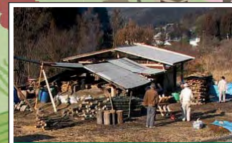
炭焼き Charcoal 里山の資源を活用した炭焼きの技術と文化が継承されています。Traditional skills and charcoal culture are preserved through utilization of resources in secondary forests.