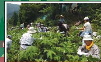
里の恵みを活かした地域振興 Regional vitalization through utilization of natural resources 里の恵みを活かして、都市と農村の交流による地域活性化が図られています。Regional vitalization projects are underway in the form of utilization of natural resources and the promotion of exchanges between villages and cities.