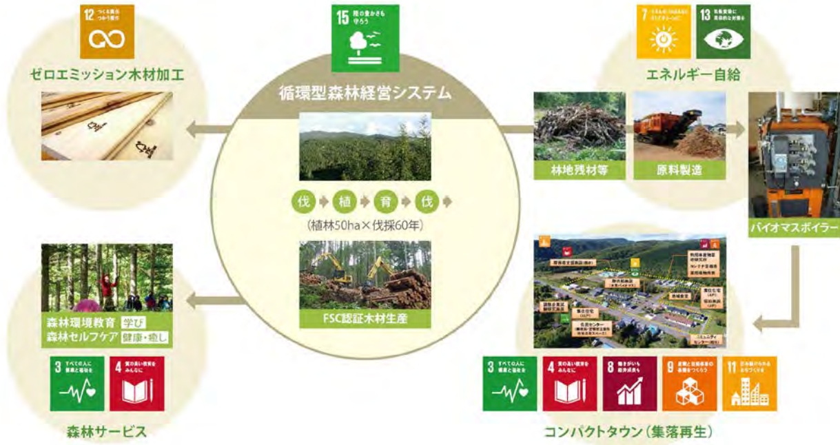
図：経済、社会、環境に統合的に取り組む下川町の事業モデル例

このような下川町の取組は、日本政府から「環境モデル都市」(2008年)、「環境未来都市」(2011年)、「地域活性化モデルケース」(2014年)などの選定を受けて進められています。また、2017年12月には、日本政府のSDG推進本部が実施する「第1回ジャパンSDGsアワード」の内閣総理大臣賞を受賞するなどの評価を受けています。