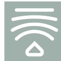
レジリエント（強靱）な発展