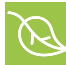
自然に基づく発展