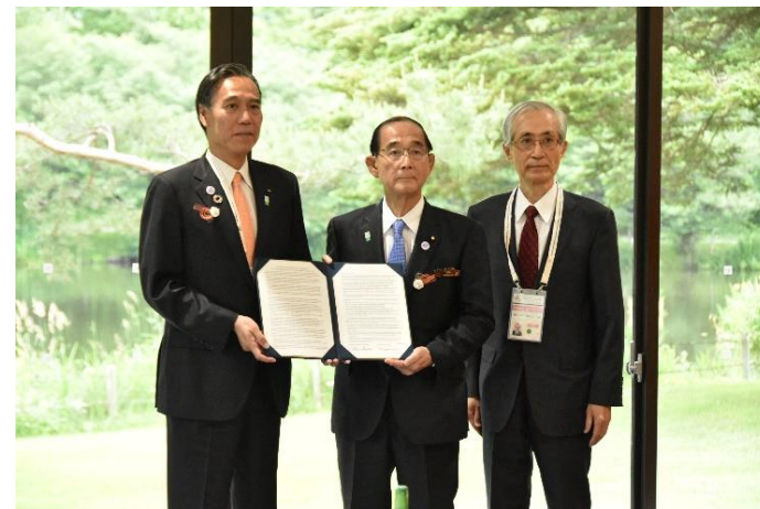
原田環境大臣に「長野宣言」を手交 (2019年6月14日)