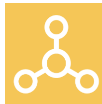
公平で人間中心の発展