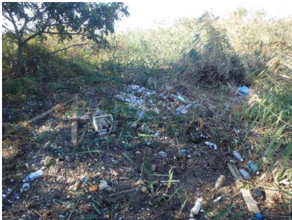
ごみ撤去作業前（名四国道下付近）