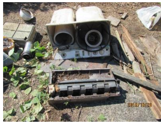
ごみ撤去作業（サンビーチ日光川横）