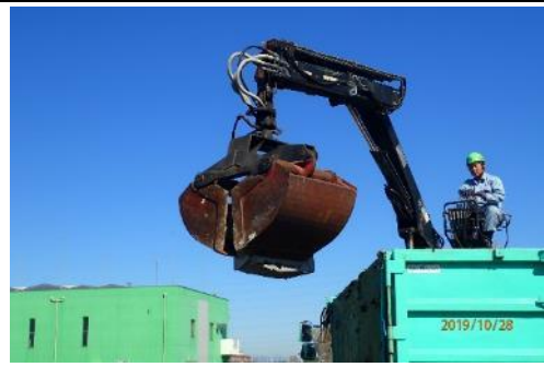
ごみ撤去作業（戸田茶屋排水機場南）