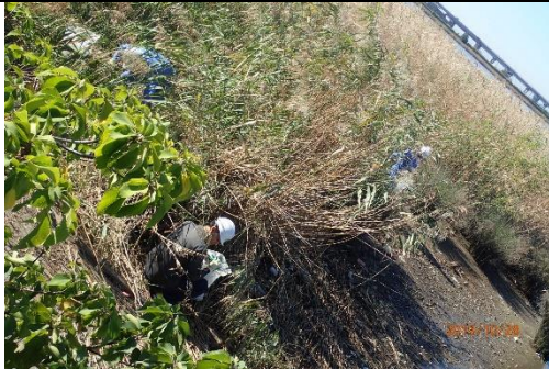
ごみ撤去作業（戸田茶屋排水機場南）