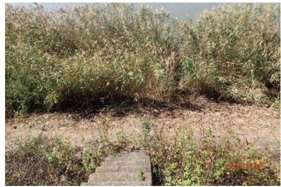
ごみ撤去作業後（サンビーチ日光川横）