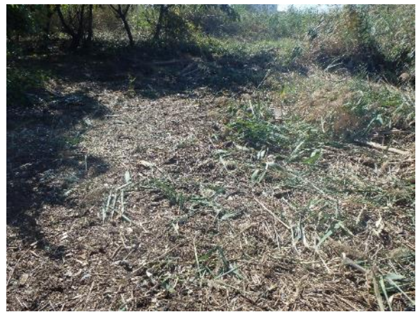
ごみ撤去作業後（名四国道下付近）