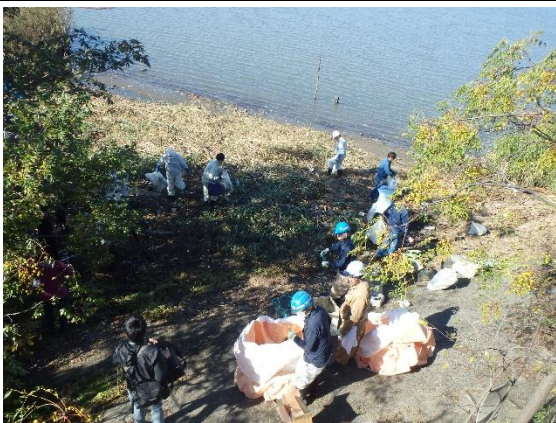
ごみ撤去作業（名四国道下付近）