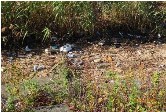
ごみ撤去作業前（サンビーチ日光川横）