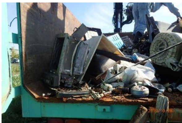
ごみ撤去作業（サンビーチ日光川横）