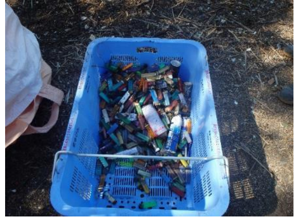
ごみ撤去作業（名四国道下付近）