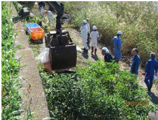
ごみ撤去作業（サンビーチ日光川横）