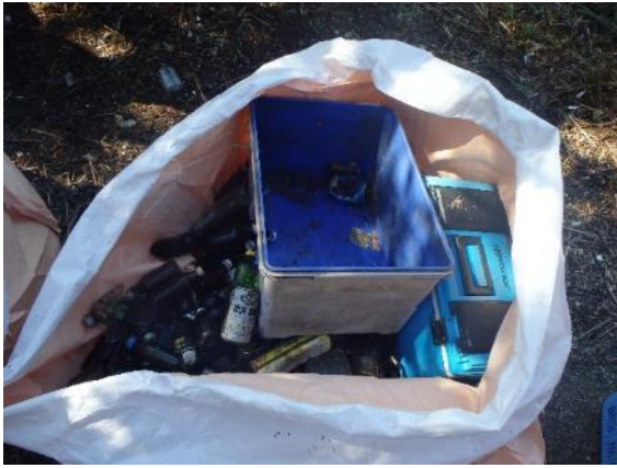
ごみ撤去作業（名四国道下付近）