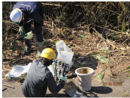
ごみ撤去作業（サンビーチ日光川横）