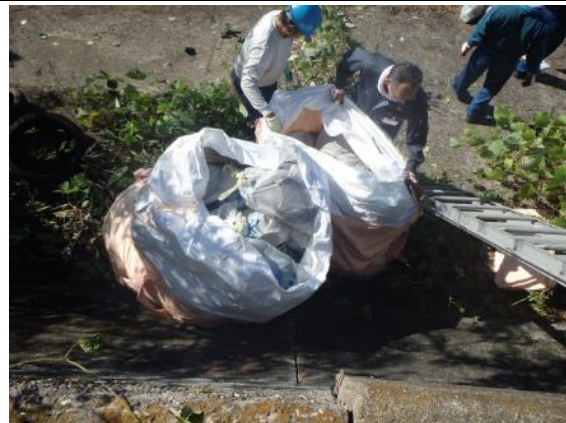
ごみ撤去作業（名四国道下付近）