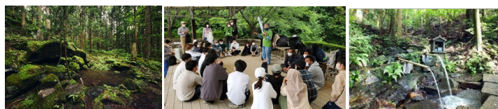
歴史的湧水による町づくり