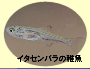
イタセンパラの稚魚