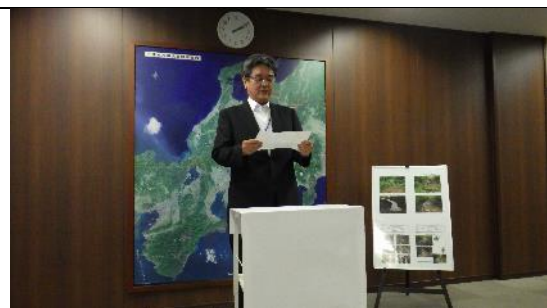
写真2 表彰式の様子