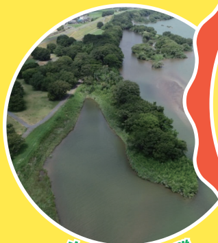
木曽川のワンド群