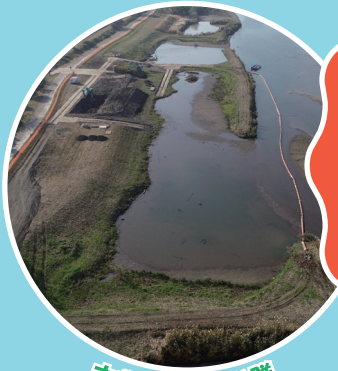
木曽川のワンド群