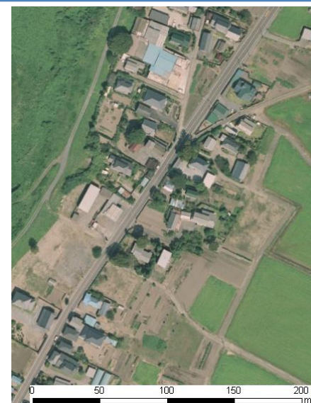
国土地理院地図(オルソ画像)