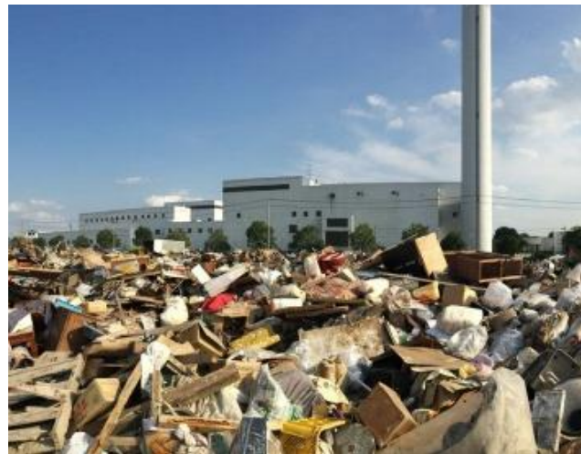
平成27年9月15日撮影 茨城県常総市 一次仮置場の搬入状況