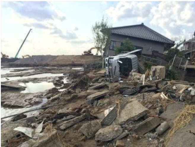
平成27年9月15日撮影 茨城県常総市 被災状況