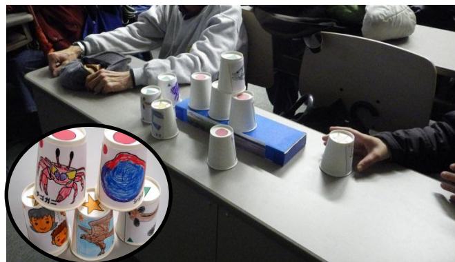
【紙コップで考える生態ピラミッド】