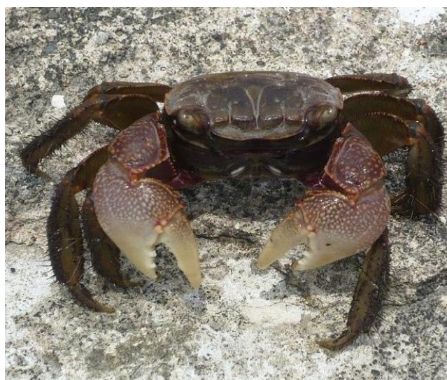
＊子供たちに大人気だったクロベンケイガニ