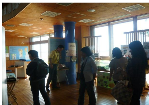
* 講義の様子（写真上）と館内案内（写真下）