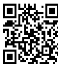
メールアドレスのQRコード