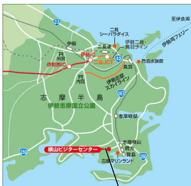
横山天空カフェテラス (横山展望台内)

※16:30から19:45まで、横山展望台駐車場と創造の森横山駐車場の間で無料送迎車を運行します。