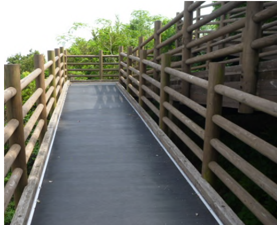
現在のスロープの様子