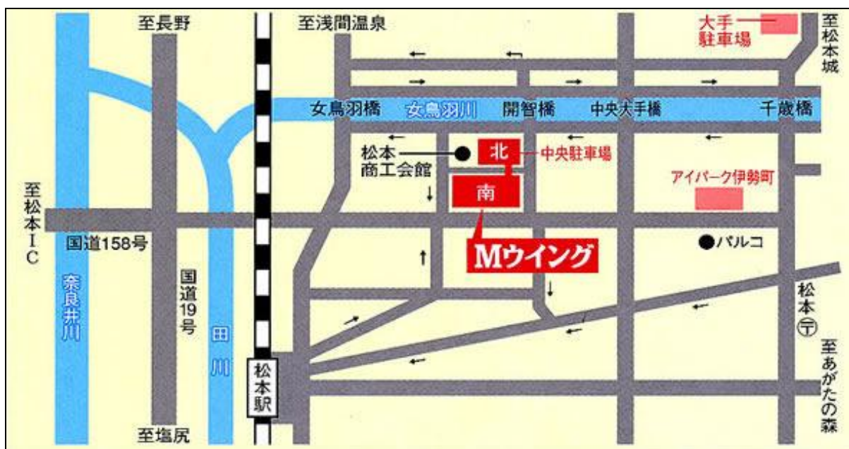
図 Mウイング位置図

■開催場所：松本市中央公民館Mウイング 3階 3-2会議室 TEL:0263-32-1132 （長野県松本市中央1-18-1）