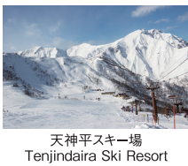
天神平スキー場 Tenjindaira Ski Resort