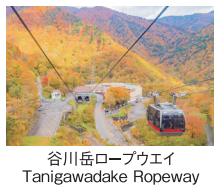
谷川岳ロープウェイ Tanigawadake Ropeway