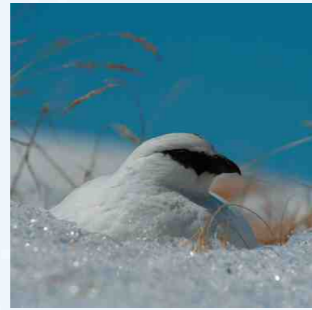
雪の中で身を休めるライチョウ