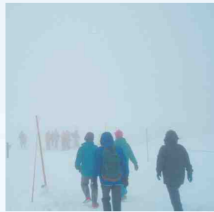
霧や雪で数m先が見えなくなることがあります