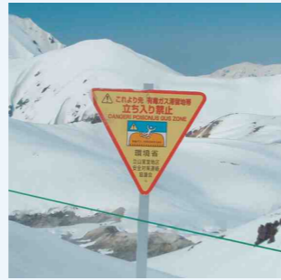
有毒ガスを知らせる立入禁止看板