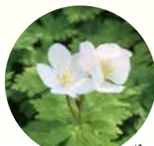
大倉新道のニリンソウ