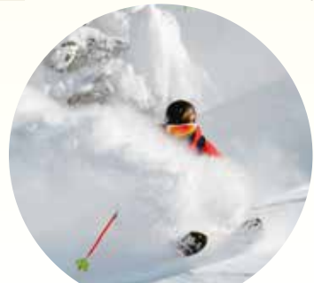
バックカントリースキー