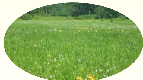
北ドブ湿原のお花畑

志賀高原地域では、北ドブ湿原周辺から毛無山にかけての稜線付近を、希少な湿原植物や猛禽類の生育、生息環境を保護するために、主にスノーモービルを対象とした乗入れ規制地区に指定しました。規制期間は毎年11月30日から6月1日までです。