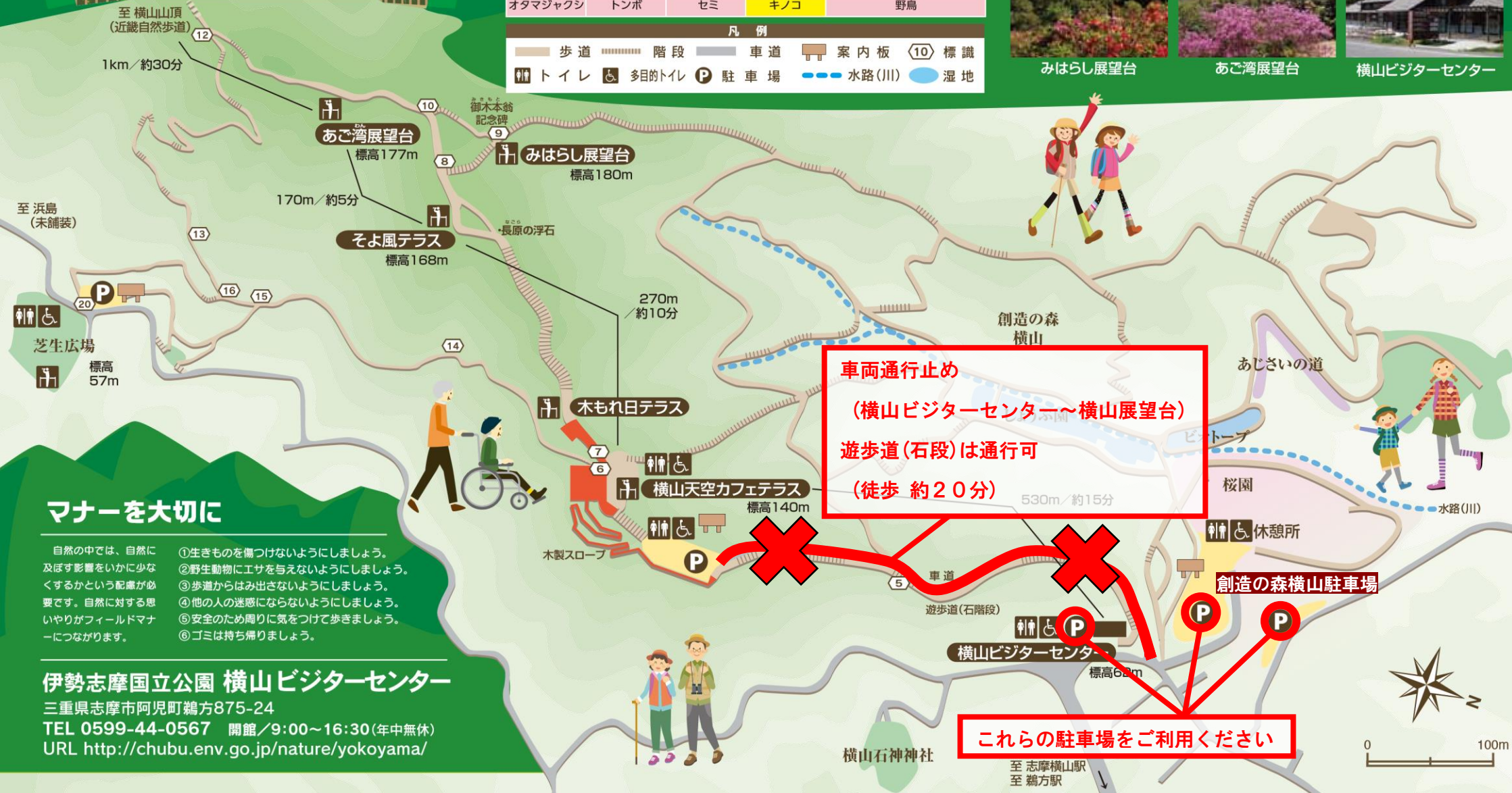
横山ビジターセンター

車両通行止め (横山ビジターセンター～横山展望台) 遊歩道(石段)は通行可 (徒歩 約20分)