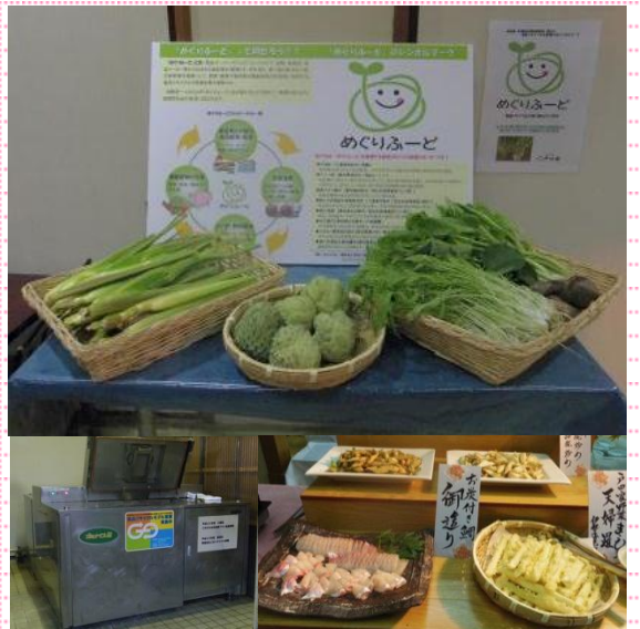
上：めぐりふーどで生産された野菜 左下：たい肥を製造する処理機 右下：宿泊客に提供されるメニュー

戸田家は、早くから食品リサイクルに取り組んできた旅館です。 旅館で発生した食品残さ を館内の処理機でたい肥にして、たい肥を利用し生産された野菜（マコモダケなど）や果物（ミカンなど）を使った料理を提供しています。また、全国初の取組であるリサイクル飼料で育てた 養殖マダイ の生産も開始しました。