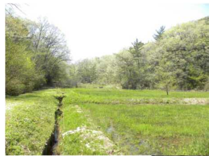
(上・矢並湿地 全景 右・上高湿地シデコブシ)

矢並湿地は草本群落が優先し、上高湿地と恩真寺湿地は、草本群落とシデコブシを中心とする温帯林である。周伊勢湾地域の多くの固有種を有するほか、大陸系の隔離分布種が存在している湿地である。