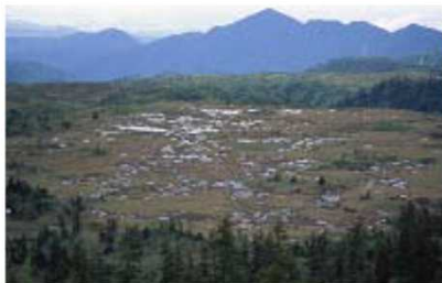
(立山弥陀ヶ原・大日平 全景)

雪田草原である弥陀ヶ原・大日平と豊富な水量を誇る称名溪谷と称名滝からなる。過去の火山活動によって形成されたなだらかな「溶岩台地」上に広がり、寒冷な気候と豪雪、豊富な水、強風の影響を受けて成立した湿地である。