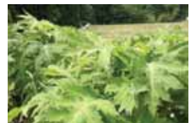
地域の豊かなめぐみを味わって山里を知る