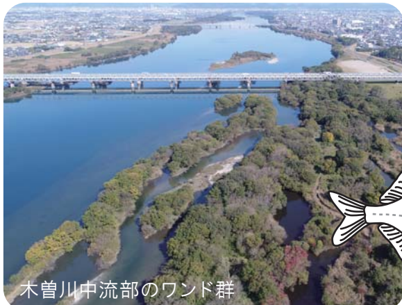
木曽川中流部のワンド群

イタセンパラ(コイ科タナゴ亜科)は、二枚貝に産卵する日本固有のタナゴ類の1種です。分布は濃尾平野を含む国内3地域に限られ、いずれの地域においても絶滅が危惧されており、国の天然記念物に指定されています。