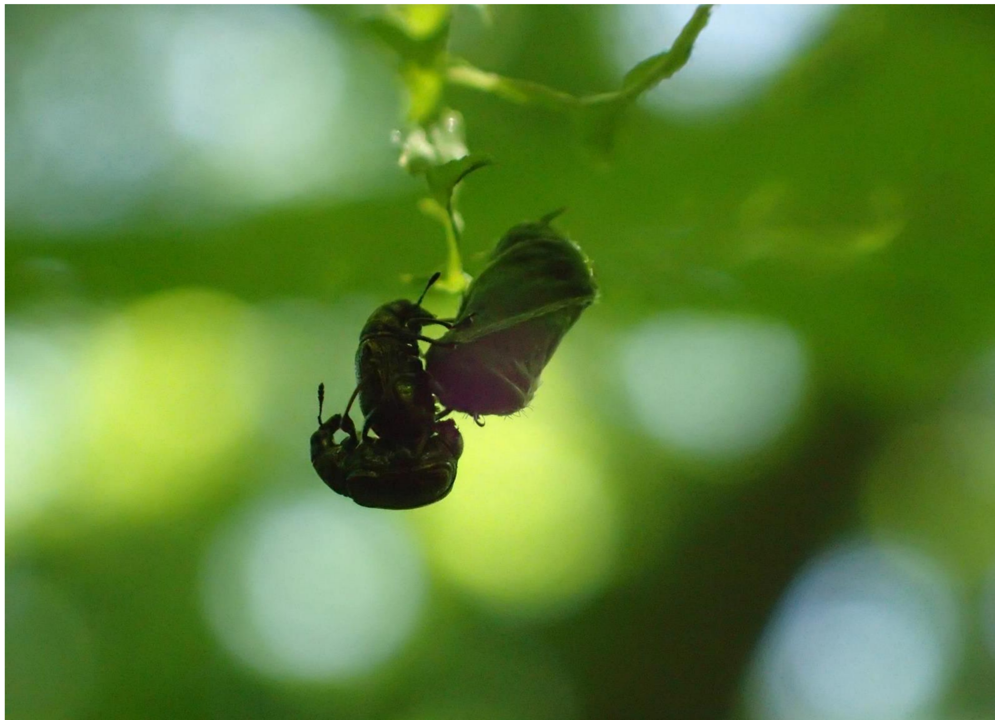
命のゆりかご

中部地方の「国指定藤前干潟鳥獣保護区」、「白山国立公園」、「伊勢志摩国立公園」の自然を守るレンジャーとアクティブ・レンジャーが撮影した自然の風景や生きものたち。今年も名古屋・白山・伊勢志摩の3地域6ヵ所を巡回します。