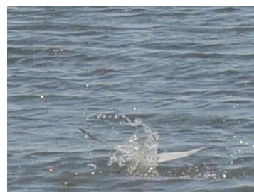
コアジサシのダイビング

さっきのウだってすごいすもんね。たまに、藤前干潟でウナギの飲み込むシーンを見るんですよ。あれ見てもね、私らだったらウナギ一匹も食べられないけど、彼ら平気で飲んじゃうでしょう。ウも集団で漁とかいろんなことやってますし。でも、竹生島（琵琶湖に浮かぶ島）は、木がウの被害にあってるって話を船頭さんが言ってましたけどね。増えすぎてもいかんし、足らんでも困るし、やっぱ