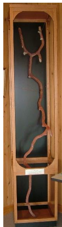
アナジャコの巣型

最近アナジャコがたくさんいる藤前干潟の奥へは観察会などでも行くことがなくなり、あまりアナジャコの姿を藤前干潟で見てないのでさみしいですけどね。昔はもっと奥の方に行っていました。以前はもっと干潟もドロドロしていましたが、今はかなり固くなっていますよね。昔ならちよっと干潟に立っただけでも、やばいやばいという感じで体が沈んでいたんです。今は、ずっと立ってても沈んでいかないし、10年前と今とではかなり泥の質が変わったんでしょうね。今の干潟は歩きやすくて良いかなと思うけど、逆にゴカイなどが全然いない。今年（平成24年）の