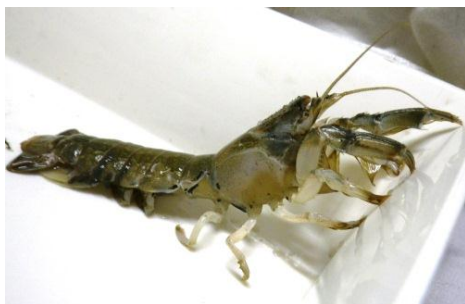
藤前干潟のアナジャコ

アナジャコがシンボルだと思ってますね。ある意味じゃ藤前はアナジャコで助けられたのかな、という気がします。アナジャコは2.5~2.6mの穴を掘るんですけど、最初、みんなそんなことは知らなかったんですよ。名古屋市のアセス（環境アセスメント）では、干潟の表層しか調べなかったから、深いところに住んでいるこのアナジャコを見つけることができなかった。表層だけの生き物の数字で干潟の重要