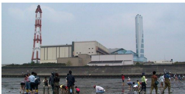
平成13年頃の旧南陽工場（左手前）と新南陽工場（右奥）

それと、当時はダイオキシンという言葉が世の中に蔓延してました。私たちは、ダイオキシンから子供を守るという会を地元で作ったんです。名古屋市の埋め立て計画では焼却場の灰を埋めるというのもあったんで、ダイオキシンにはすごく敏感だったというのもありました。今は新南陽工場だけがあ