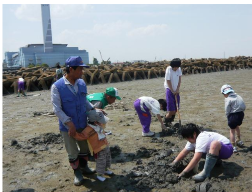
クリーン大作戦後の干潟観察会

私たちが最初の頃は導流堤を勧めてたのもあったからかもしれませんが、メイン会場の導流堤に行かれる方が多かったです。今はまず最初藤前会場へ来て下さいと極力ご案内してます。ここは藤前活動センターがあるので、水もあるしお手洗いもあるし、事故の確率も減るって言うことがありますからね。そして、いったん藤前に来られたら、次回はメイン会場（導流堤）へ行ってくださいとご案内しています。導流堤は、ちょっと不自由さがあるかも知れないが、あいち防災リーダー会のご協力で防災訓練の一貫で行われている炊き出しで作っていただいたシシ汁（猪の豚汁）とおにぎりもあるし、清掃後の干潟観察会も環境省の皆さんにちゃんとやってもらえるし、楽しいよって言う話をさせてもらっていますね。導流堤と藤前海岸の両方の藤前干潟を見ていただきたいっていうのもあります。