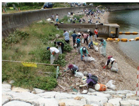
答志島奈佐の浜清掃

那市) だとか多治見(岐阜県) だとか、庄内川・新川の縦のラインしかつながりがなかったんですけど、今年から始まった答志島(三重県鳥羽市)の奈佐の浜清掃のおかげで四日市とかの横のつながりもできて、三重県と岐阜県とジョイントできるようになりましたから、いいことだなと思ってますね。伊勢湾流域としてつながっているんですから、このように活動が広がっていけばいいと思いますね。