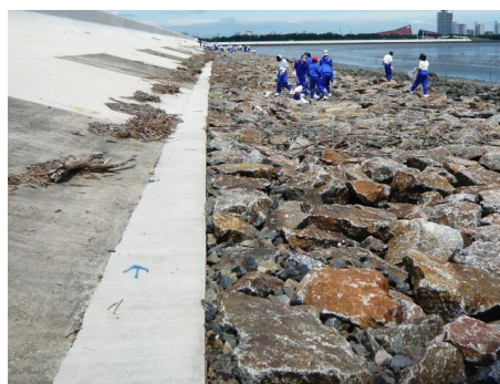
南陽（藤前）海岸堤防の小段

藤前干潟には、残されたからこそ多くの人に来てほしい、という思いがあるんですよ。藤前干潟協議会で、藤前干潟に面する堤防に小段を作るかどうかの議題が出たとき、作るのに結構反対意見がありました。私は多くの人が藤前干潟に来て、リピーターもたくさん来てほしいと思ってるんです。小段があればすごく歩きやすいし、干潟に近くなりますから、小段を作るのに賛成したんですよ。あまり来る人を制限すること自体好きじゃないですね。来てもらったら極力干潟に入ってもらいたいですね。干潟への立ち入る範囲は、ある程度ルール化して、「これ以上行かないでね」、と言えればいいと思うし。尾瀬（福島県・新潟県・群馬県・栃木県にまたがる湿原）なんかは、人が歩ける木道がちゃんと整備されて、行けるところは決まって、自然にそんなに負荷はないと思うし。藤前でもそうなれたら一番いいなあと思ってますけどね。尾瀬も四季で違うじゃないですか。藤前は、今は夏だから鳥たちはあまり来てないですけど、四季によって来る鳥は違うし、その良さがあるんですから、一度来た人にはまた来てもらいたいですね。