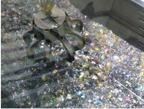
南陽工場で処理中のごみ

潟は処分場の埋め立てから守られた干潟だということをとくさんの人に知ってもらいたいですね。意外と干潟だけに目がいっちゃってますが、我々の出しているごみがちゃんと南陽工場で処理されていることや、ごみをどれだけ出しているかを見ていただくには、南陽工場のある藤前は良いところだと思うんです。今の南陽工場長になってから、3年間続けて藤前干潟クリーン大作戦の日に合わせて南陽工場の見学会をやっていただいています。干潟に