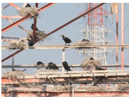
鉄塔で巣を作るカワウ

ウって黒くって大きな体していて格好良くはないんですけど、動きが素早くて、結構好きなんです。鶺鴒のウだって、速いスピードで泳ぐアユをどうやって捕まえるんだろう？っていうくらい、水の中では速いじゃないですか。それと導流堤の鉄塔のところ