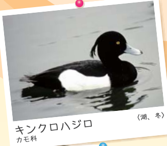
キンクロハジロ カモ科 (湖、冬)

みかたこ 三方湖 Mikata-ko 水質：淡水 最大水深：5.8m 面積：3.56km 2 周囲：9.6km