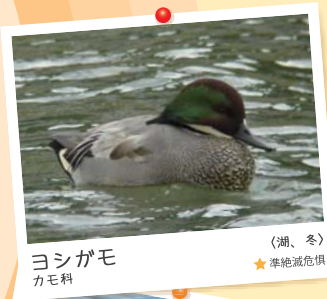
ヨシガモ カモ科 (湖、冬) ★準絶滅危惧