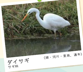
ダイサギ サギ科 (湖・河川・里地、通年)