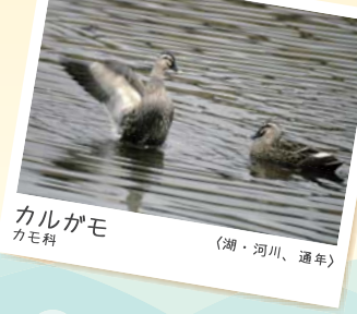
カルガモ カモ科 (湖・河川、通年)