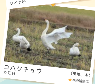
コハクチョウ カモ科 (里地、冬) ★準絶滅危惧