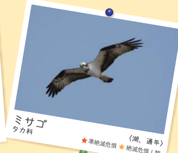
ミサゴ タカ科 (湖、通年) ★準絶滅危惧 ★絶滅危惧Ⅰ類