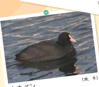
オオバン ワイナ科 (湖、冬)