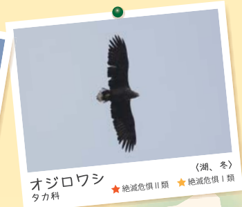
オジロワシ タカ科 (湖、冬) ★絶滅危惧Ⅱ類 ★絶滅危惧Ⅰ類