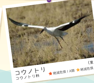
コウノトリ コウノトリ科 ★絶滅危惧ⅠA類 ★絶滅危惧Ⅰ類