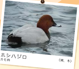
ホシハジロ カモ科 (湖、冬)