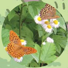
ヒョウモンチョウ