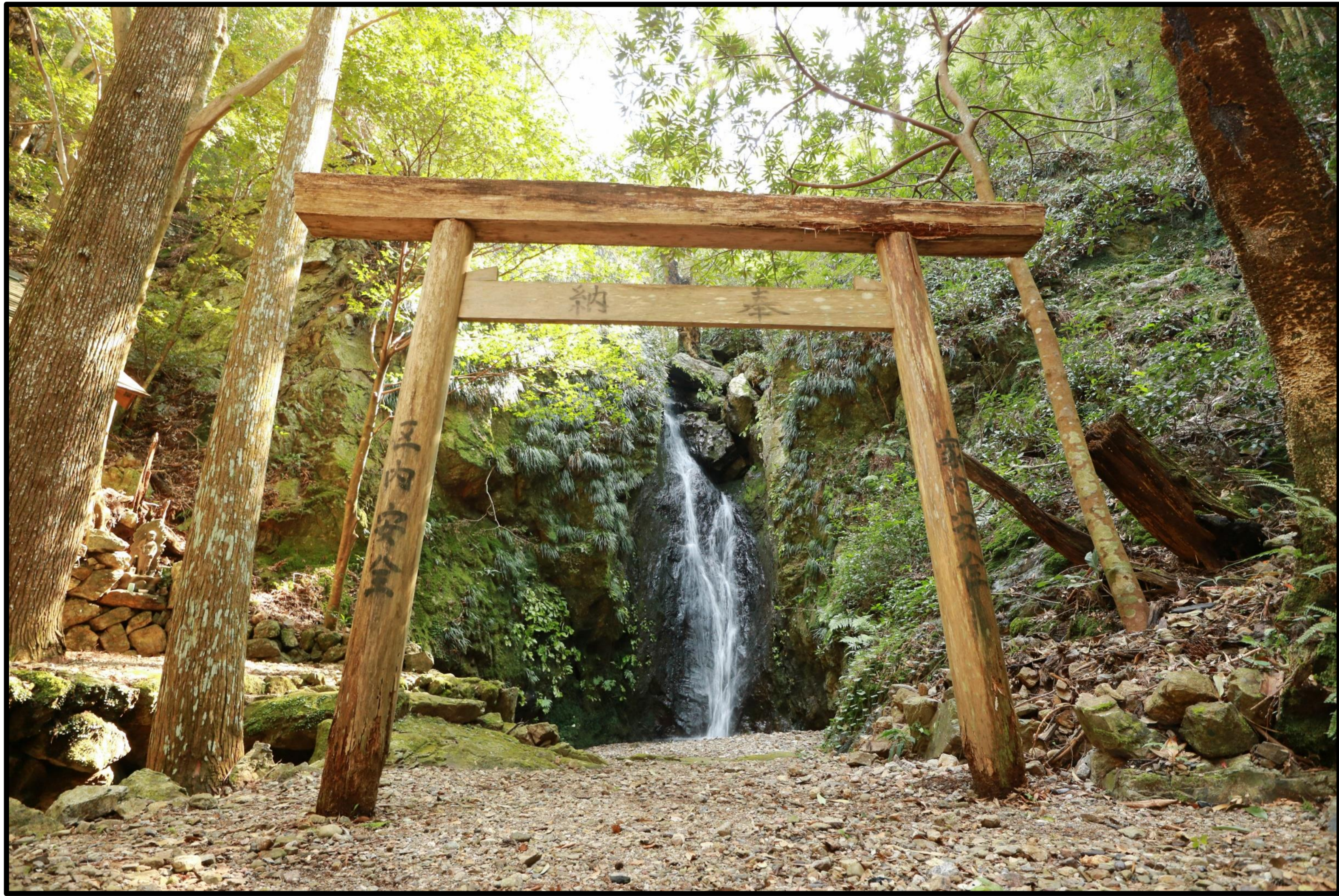
白龍の住む滝(伊勢志摩国立公園)

中部地方の「伊勢志摩国立公園」、「白山国立公園」、「国指定藤前干潟鳥獣保護区」の自然を守るレンジャーとアクティブ・レンジャーが撮影した自然の風景や生きものたち。今年も名古屋・白山・伊勢志摩の3地域6カ所を巡回展示します。